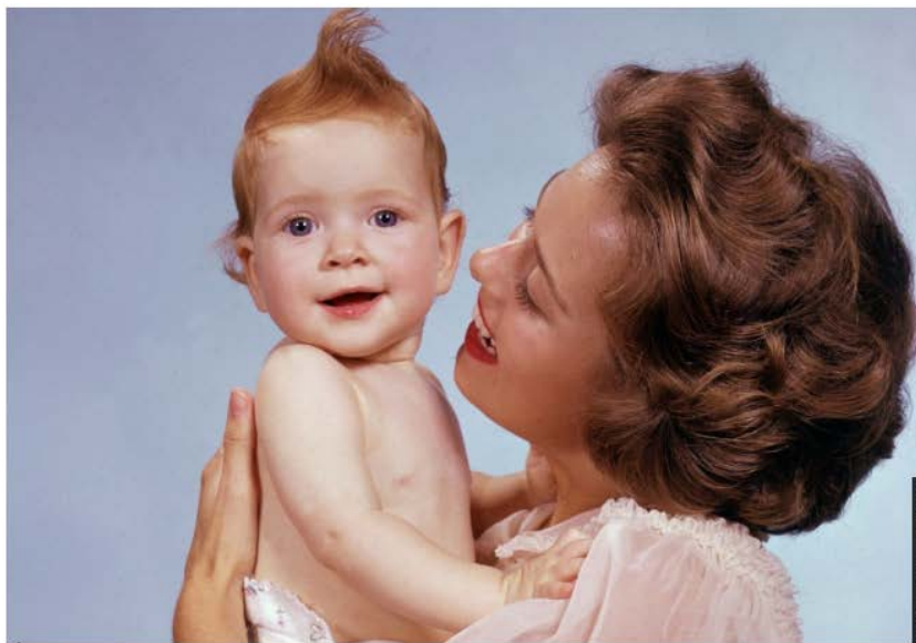
IL MAMMISMO È TERAPEUTICO

Secondo pediatri e chirurghi un legame forte con la famiglia è un antidolorifico naturale.